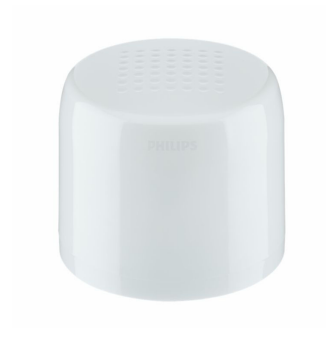
Product Photo LLC7813