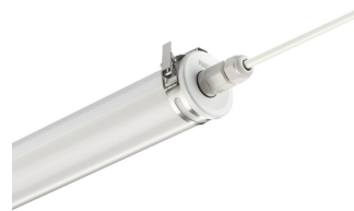
CoreLine tubular waterproof, easy connection