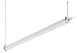
CoreLine tubular waterproof on a suspension chain