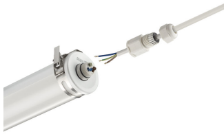
CoreLine tubular waterproof, installation