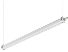
CoreLine tubular waterproof on a suspension wire