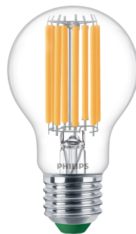
LED CLA 100WA60 E27 2700K CL UE SRT4