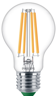
LED CLA 60W A60 E27 2700K CL UE SRT4