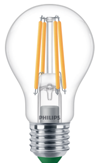
LED CLA 60W A60 E27 2700K CL UE D SRT4 RTP