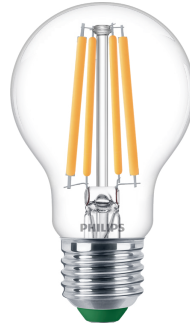
LED CLA 60W A60 E27 2700K CL UE SRT4