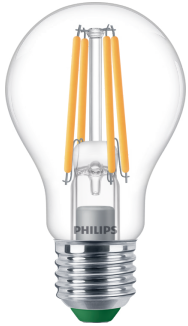
LED CLA 60W A60 E27 2700K CL UE D SRT4 RTP