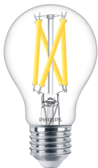
LEDclassic 75W A60 E27 CL WGD90 SRT4 1