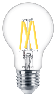
LEDclassic 40W A60 E27 CL WGD90 SRT4 1