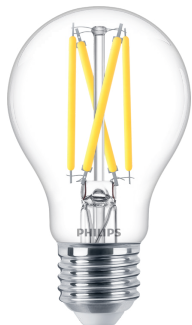
LEDclassic 60W A60 E27 CL WGD90 SRT4 1