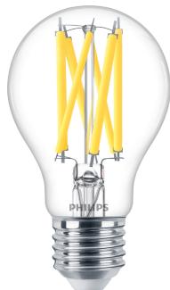
LEDclassic 100W A60 E27 CL WGD90 SRT4 1