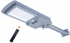
Essential SmartBright All-in-one Solar Pathway Light