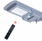
Essential SmartBright All-in-one Solar Pathway Light