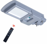
Essential SmartBright All-in-one Solar Pathway Light