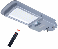
Essential SmartBright All-in-one Solar Pathway Light