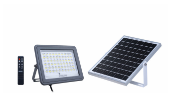
Essential SmartBright Solar Flood Light