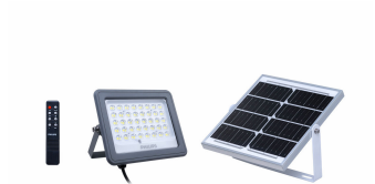
Essential SmartBright Solar Flood Light