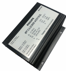
ComboCC Gen 4.0