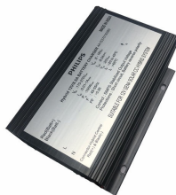
ComboCC Gen 4.0 Hybrid Supply Unit