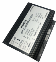
ComboCC Gen 4.0