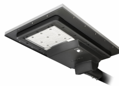
SunStay 4500 Lumen