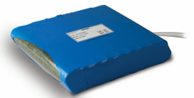
Lithium Ferro Phosphate battery