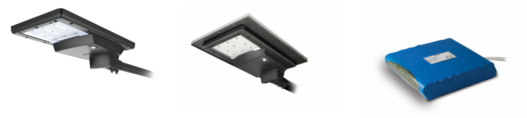
standard shot sunstay