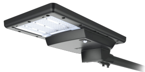
standard shot sunstay