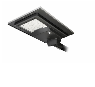
SunStay 4500 Lumen