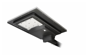
SunStay 4500 Lumen