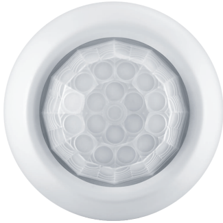
LEDTForce HB Accessory