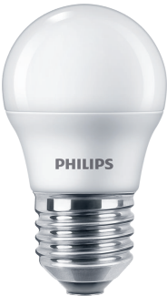
LEDbulb G45 E27 FR P1