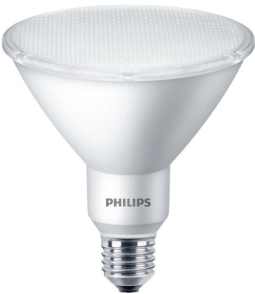
LEDspot MAS 120W E27 PAR38 830 25D ND