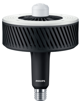
LEDTForce HPI Others E40 sensor