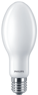
LEDTForce MAS HPL ED90 E40