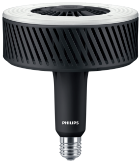
LEDTForce HPI Others E40