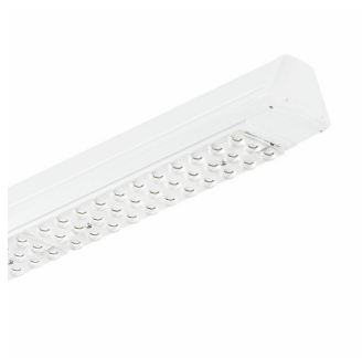
IPPR 4MX850i 0007