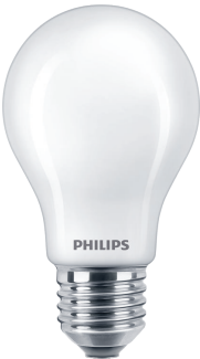
Bulb A67 100W 1521lm 2700K E27 NDFrosted