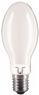
LPPR SON E40 E39