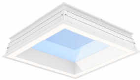
LP913P NC3 SKYLIGHT W60L60