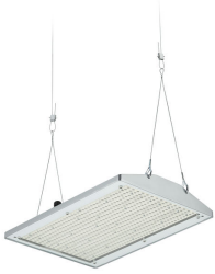
GentleSpace gen4-large, suspension