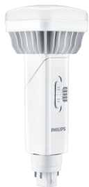
Product standard image