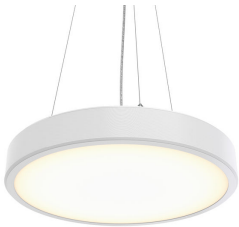
Essential Suspended RTP