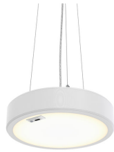
Essential Suspended RTP