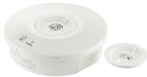
EM152C Emergency Recessed Downlight family