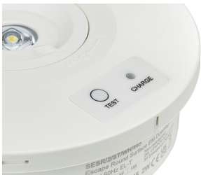
EM152C Emergency recessed Downlight details