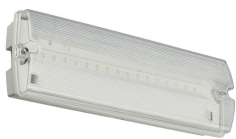
Emergency Bulkhead_EM153C SPP02