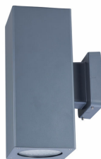
Uni Wall Sconce