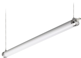
CoreLine waterproof tubular G2, WT210C G2