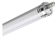
CoreLine waterproof tubular G2, WT210C G2